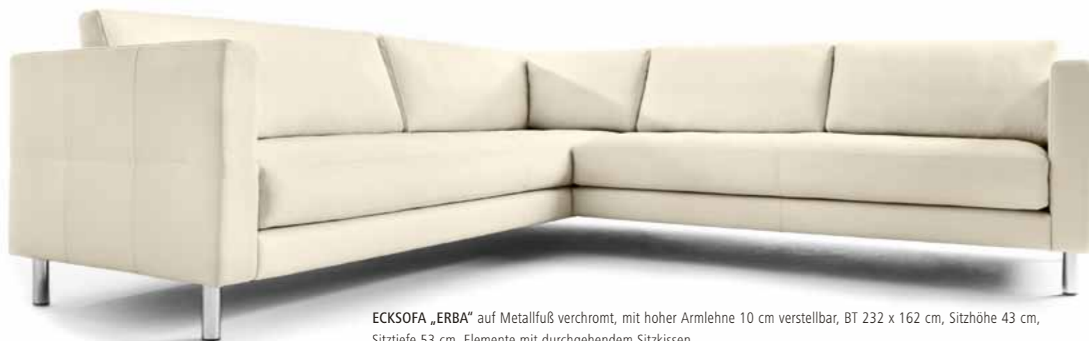
ECKSOFA „ERBA“ auf Metallfuß verchromt, mit hoher Armlehne 10 cm verstellbar, BT 232 x 162 cm, Sitzhöhe 43 cm, Sitztiefe 53 cm. Elemente mit durchgehendem Sitzkissen.

DESIGN UND KOMFORT IN VIELFALT Klare Linien und das reduzierte Design fokussieren den Blick auf das, worauf es wirklich ankommt: auf das reine Sitzvergnügen. Unterschiedliche Fuß-Formen und Armlehnen-Breiten sowie eine große Vielfalt an Lederqualitäten geben Ihnen den Raum, dieses flexible Sofaprogramm ganz nach Maß zu gestalten.